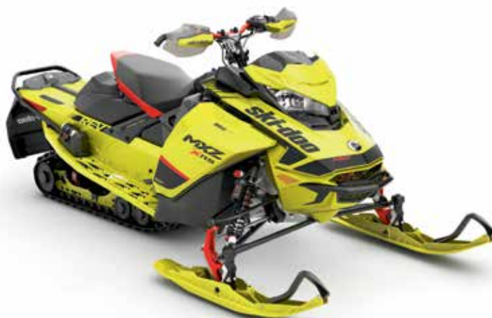
MXZ® X-RS® 850 E-TEC® montré